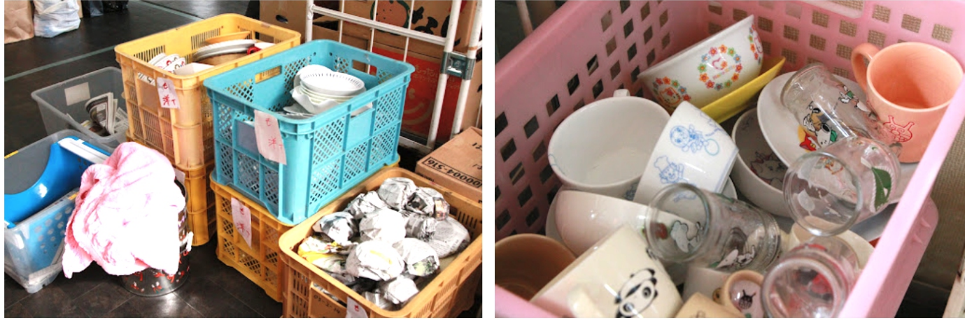
〈協業している障がい者施設に物資を届けたときの様子〉